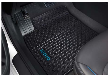
Gumiszőnyeg garnitúra - 23 200 Ft