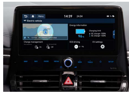
10,25"-os Navigációs rendszer