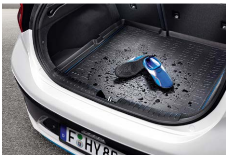
Csomagtértálca - 24 600 Ft