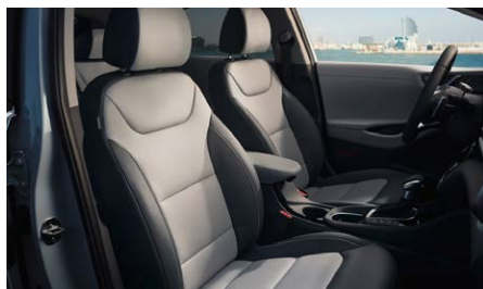
Shale Gray (YPK) belső