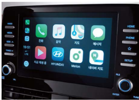
8"-os Display audio rendszer