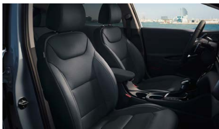
Fossil Gray (T9Y) belső