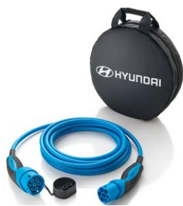
Gyári Type 2 töltőkábel - 109 990 Ft