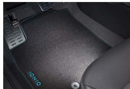
Velúrszőnyeg garnitúra - 25 200 Ft